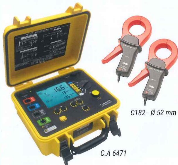
C182 - Ø 52 mm