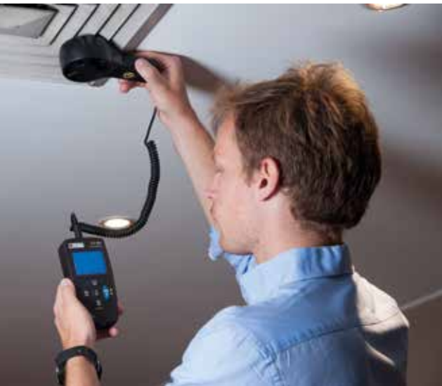
Ejemplo de medida con un termoanemómetro CA 1227

En instalaciones accesibles al público como escuelas, guarderías, oficinas, salas de seminarios, talleres, transporte público, hospitales, etc. el distanciamiento físico por sí solo no es suficiente. El posible riesgo de infección por aerosol existe principalmente en las estancias que no están suficientemente ventiladas o en las que no es posible el intercambio de aire.